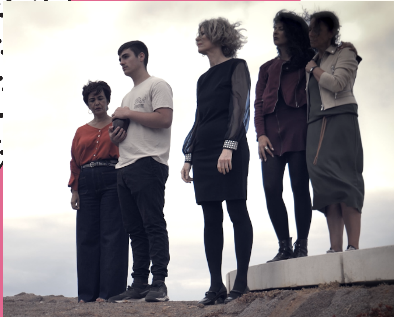
PERSONAJES EN LA ESCENA AUDIOVISUAL

LA ESCENOGRAFÍA MINIMALISTA, VERSÁTIL, EN CONJUNTO CON EL VESTUARIO Y EL MAQUILLAJE, ACOMPAÑAN LA TRAMA Y REFLEJAN EL TRANSCURRIR DEL TIEMPO Y LAS EXPERIENCIAS VIVIDAS POR LOS PERSONAJES.